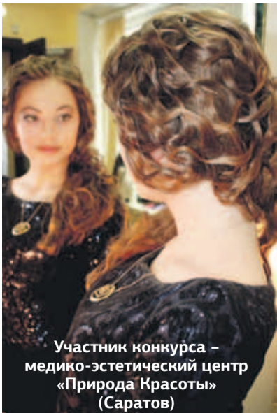
Участник конкурса – медико-эстетический центр «Природа Красоты» (Саратов)

Приз зрительских симпатий - туристическая путёвка - путешествие по городам Золотого кольца России.