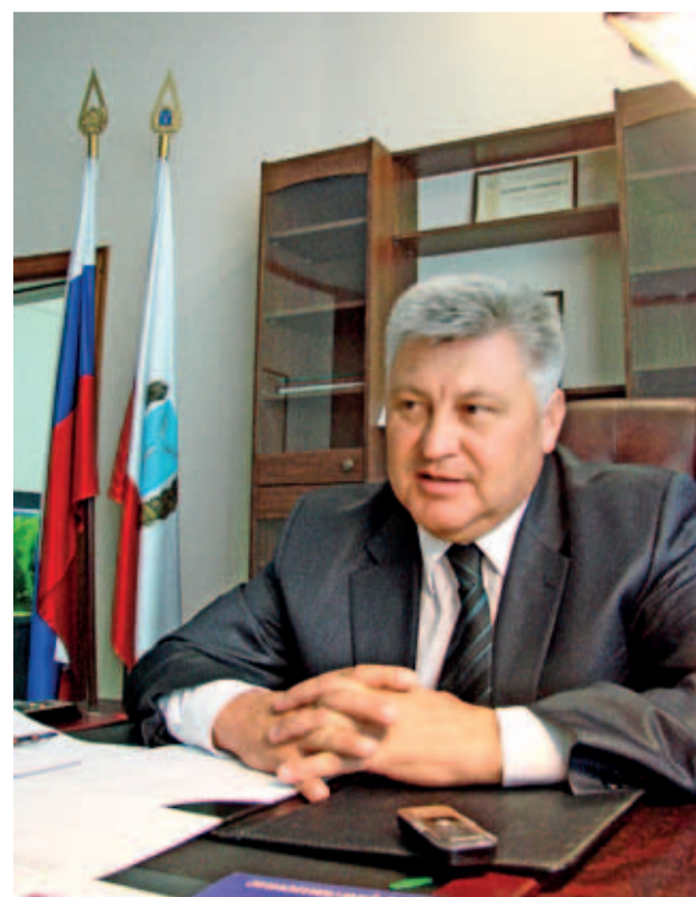
Игорь Потапов. Министр экологии и природных ресурсов области