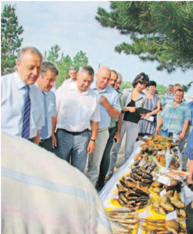
Рыбный стол в Новых Бурасах