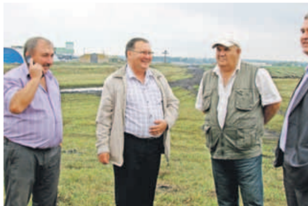
«День Поля - 2013» в Турковском районе