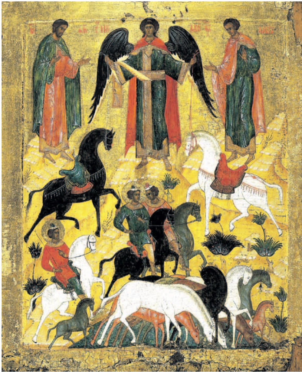
Святые Флор и Лавр - покровители лошадей.

Отмечают праздник именно в день памяти мучеников Флора и Лавра не случайно. Эти святые почитаются как покровители лошадей и другого домашнего скота.