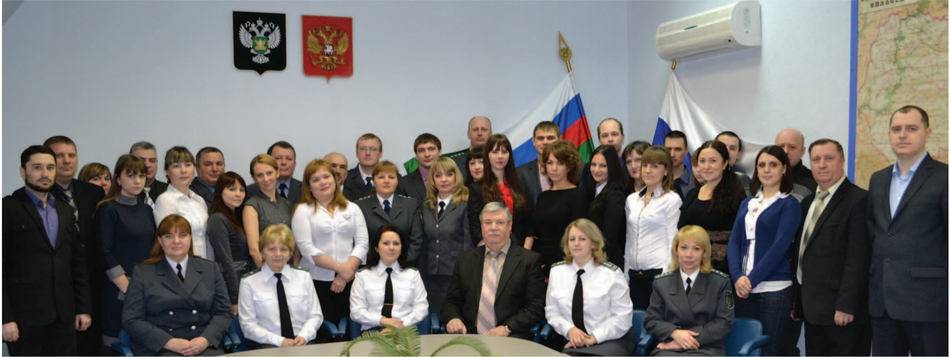
Коллектив Управления Россельхознадзора по Саратовской области

Управление Федеральной службы по ветеринарному и фитосанитарному надзору по Саратовской области было создано приказом Руководителя Федеральной службы по ветеринарному и фитосанитарному надзору С.А. Данкверта от 24 января 2005 года № 4 «О создании территориальных органов Россельхознадзора».