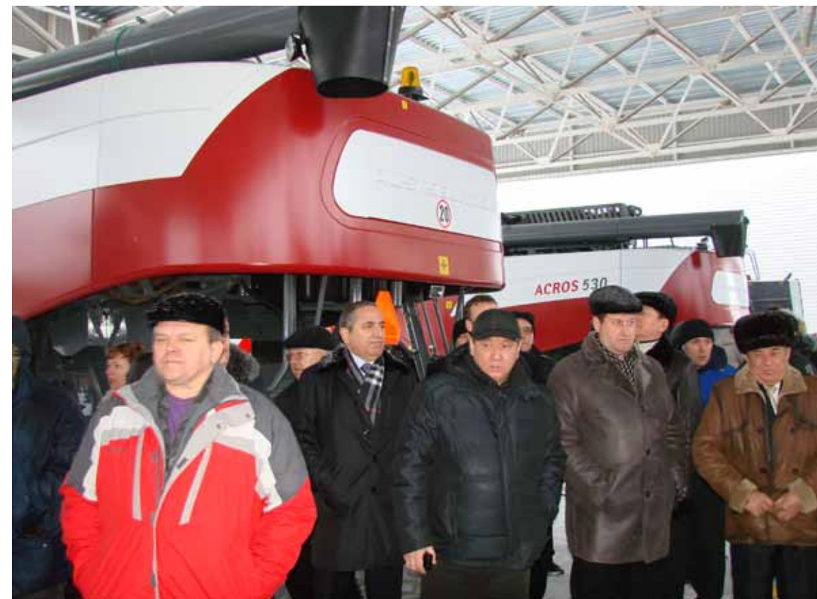
...до наших дней