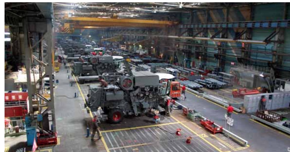
На главном конвейере