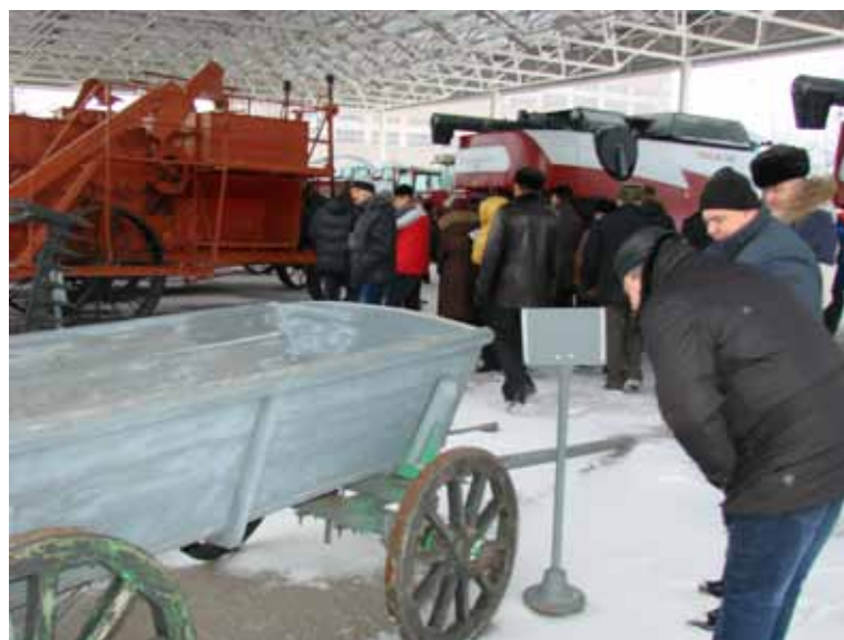
От самого начала...

СВЫШЕ 7,5 ТЫСЯЧ КОМБАЙНОВ РАБОТАЕТ НА ПОЛЯХ САРАТОВСКОЙ ОБЛАСТИ, 85% ИЗ НИХ — ЭТО ТЕХНИКА МАРКИ РОСТСЕЛЬМАШ