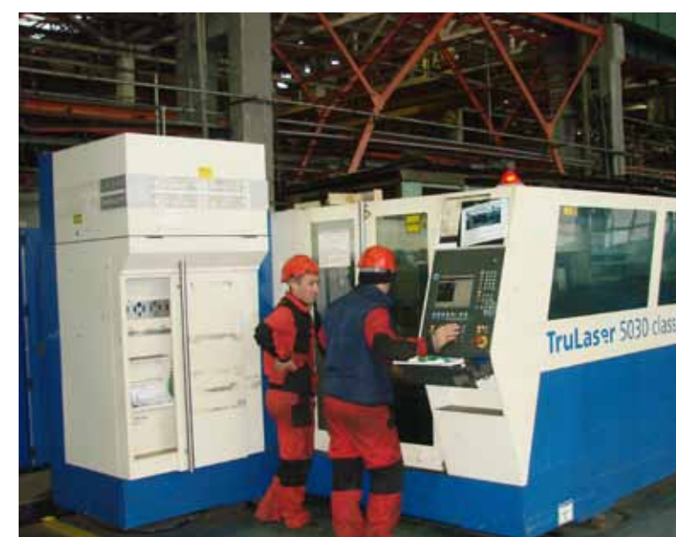
Лазерная резка металла